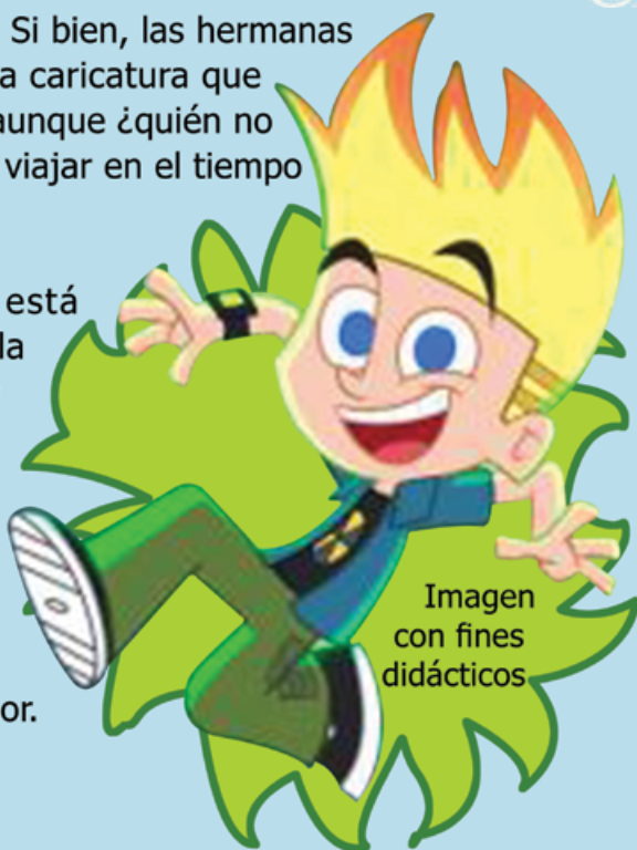
Imagen con fines didácticos

Valores Morales La serie está diseñada para entretener, así que la didáctica y la razón no estarán presentes para acercar la ciencia a los niños, y tampoco lo es para recomendarles que, si realizan algún experimento, sea con el conocimiento y consentimiento de sus padres, sobre todo si las pruebas científicas son con su hermano menor.