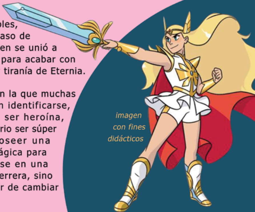
imagen con fines didácticos

Una serie con la que muchas niñas podrán identificarse, ya que para ser heroína, no es necesario ser súper fuerte ni poseer una ESPADA mágica para transformarse en una poderosa guerrera, sino tener el valor de cambiar el mundo.