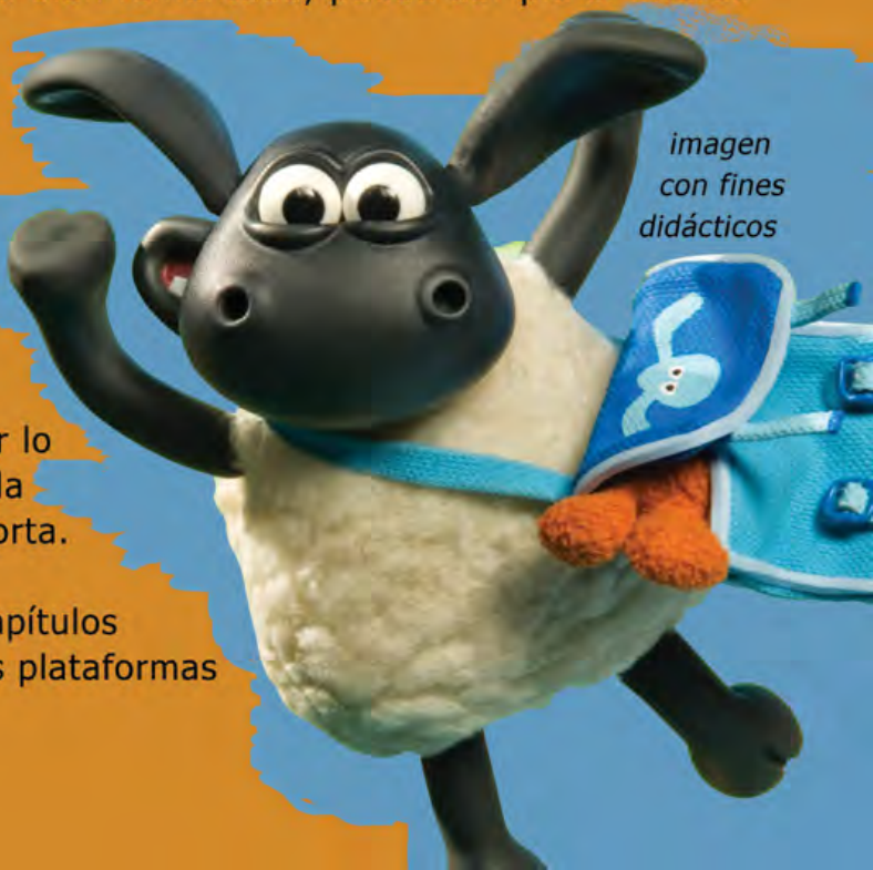
imagen con fines didácticos

Pueden encontrar capítulos en YouTube y otras plataformas digitales.